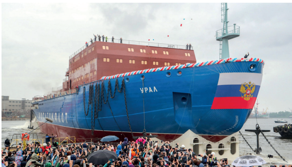
2. ábra: Ural nukleáris hajtású jégtörő hajó