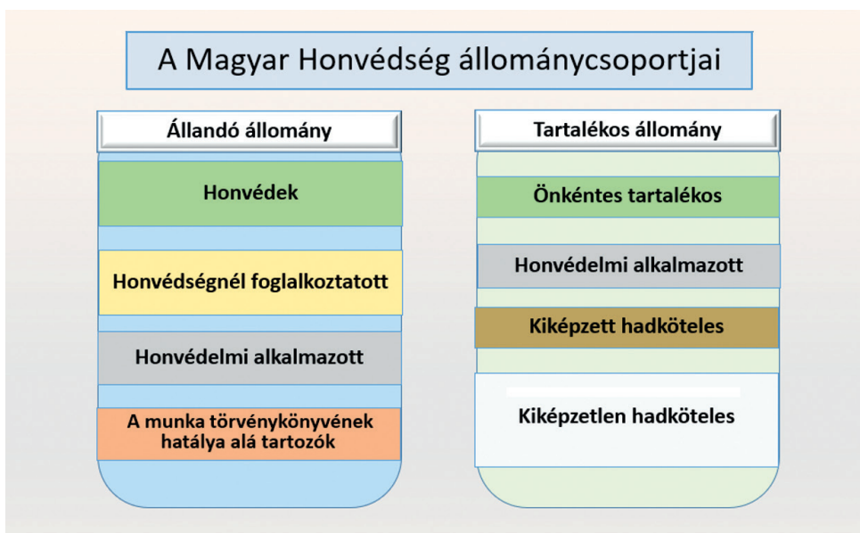
1. ábra: A Magyar Honvédség állománycsoportjai

aki 45 éves korában kiválik a Magyar Honvédségből, az tíz év után – a kiképzettség elavulása miatt – kiképzetlenné válik, viszont az 50 éves korhatárt már átlépve mentesül a hadkötelezettség alól. A hadkötelesség (kiképzett és kiképzetlen) a nagykorú, magyar állampolgárságú férfiakra vonatkozik. Viszont a hivatkozott Hvt. 71. § (7) bekezdése értelmében különleges jogrend idejében önkéntes vállalás alapján, kizárólag a különleges jogrend időtartamára 15 minden magyar nagykorú magyar állampolgár jelentkezhethet katonai szolgálatra, tehát nők is. (Bár e jelentkezők fogadására részletes szabályokat még nem dolgoztak ki.) A honvédelmi alkalmazott az állandó és a tartalékos állománycsoportba egyaránt beletartozik. A honvédelmi alkalmazott önként vállalt katonai szolgálata hadiállapot kihirdetését követően tényleges katonai szolgálattá alakul át. 16 A Magyar Honvédség állományát az 1. ábra szemlélteti.