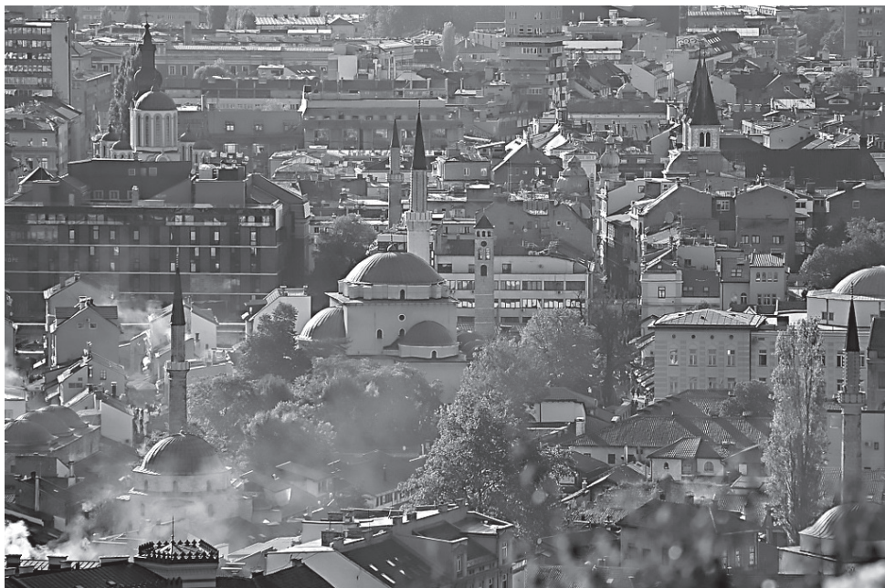
2. ábra: Katolikus templom, zsinagóga és dzsámik 100 méteren belül Szarajevó óvárosában

Szarajevó muszlim többségű multikulturális város, amely egyre kedveltebb úti cél a szaúdi és más öböl menti országok lakossága számára. Mivel a helyi törvények szerint a területen csak az vásárolhat ingatlant, aki bejegyzett gazdasági tevékenységet folytat, egyre nő a szaúdi középréteg vállalkozásainak száma a főváros környékén, illetve nagybefektetők – elsősorban Ilidža városrészben – új hotelekkel teszik még vonzóbbá a várost saját polgárai számára. A tendencia azonban valószínűleg túlmutat az üzleti tevékenységeken. Egyes európai szakértők attól tartanak, hogy Szaúd-Arábia a dzsámik és iskolák építésével, az alkohol – szaúdi befektetésből épült – bevásárlóközpontokból való kitiltásával, vagy az iskolai arab nyelvoktatással egy új, az öböl menti országokból származtatott ideológiai nevelést alapozhat meg. 40 A szarajevói muszlimok olyan liberális európaiak, akik megmutatták, hogyan fejlődhet idővel a valláshoz való viszonyulás, és hogyan lehet magunkévá tenni a modernitást anélkül, hogy feladnánk vallási identitásunkat. A történelem folyamán bosnyák gondolkodók az iszlámnak olyan kreatív teológiai értelmezéseit kínálták, amelyek összhangban voltak az európai étellel, így a boszniai muszlim közösség nem hogy alkalmazkodott a Nyugathoz, egy olyan társadalmat épített, amelyben az európai és muszlim származás nem különül el egymástól.