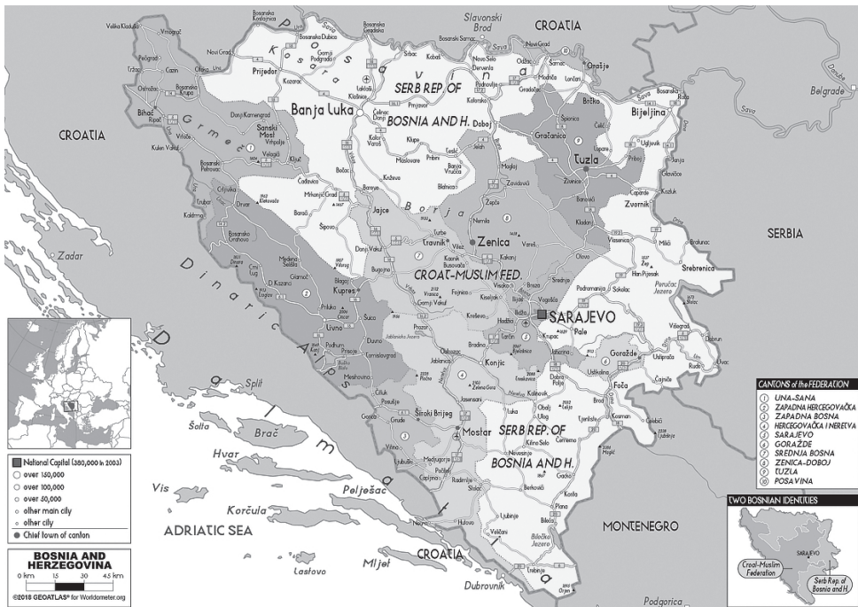
1. ábra: A két entitás (Szerb Köztársaság és Bosznia-Hercegovinai Föderáció) bemutató térkép