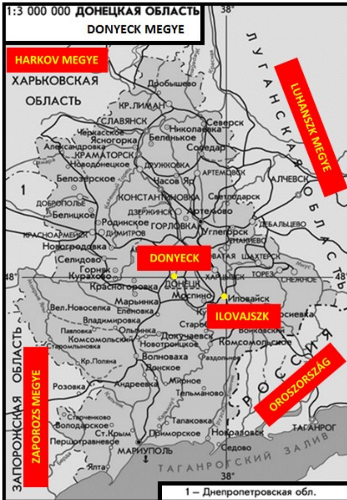
2. sz. térkép: A Ilovajszk fekvése Donyeck megyében

A 2. számú térkép alapján jól látszik, hogy Ilovajszk birtoklása stratégiai jelentőséggel bír. Ilovajszk Donyeck várostól, a szakadárak egyik fővárosától 30 km-re dél-keletre helyezkedik el, az Oroszországtól és a Luhanszki Népköztársaságtól egyaránt 50-km távolságra.