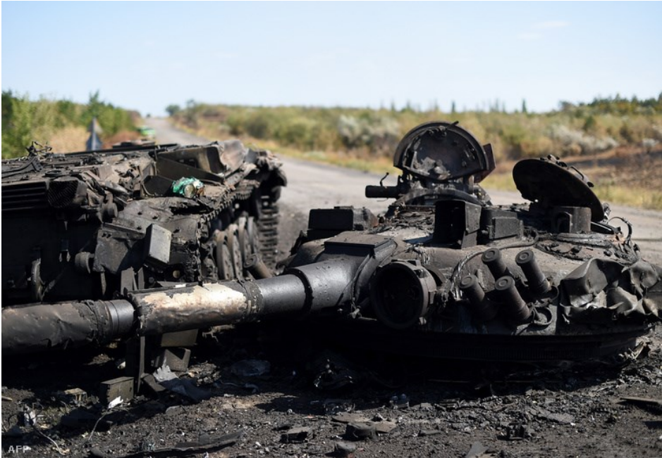
1. sz. kép: Az egyik megsemmisített harckocsi

beszélni. A haditechnikai eszközök zöme megsemmisült (1. számú kép), vagy a szakadárok hadizsákmánya lett. 13