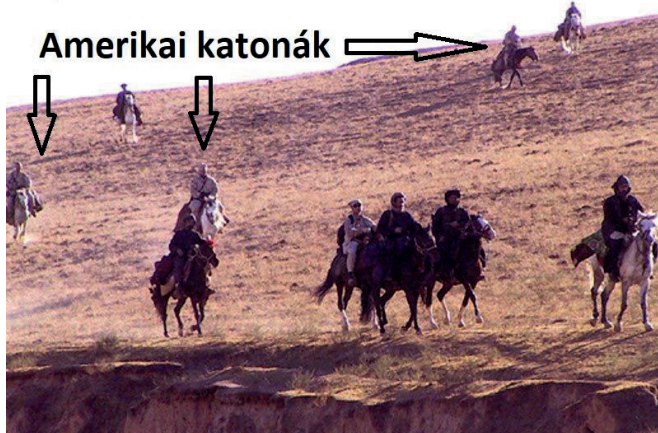
3. ábra: Donald Rumsfeld védelmi miniszter 2001. november 16-án nyilvánosságra hozott egy fotót, amelyen az Egyesült Államok katonái láthatók Darya tábornok és más afgán harcosokkal együtt a Darya Suf-völgyben