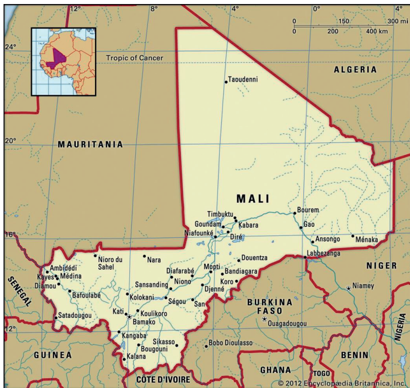
3. ábra: Mali és a lázadás kitörésének helyszíne, Ménaka

A tuaregek azonban önállóságot szerettek volna, amelynek eléréséhez előbb 1911-ben Ménaka városánál (lásd 3. ábra) tört ki lázadás a helyi tuareg törzsek részéről, amelyet a francia erőknek sikerült leverni.