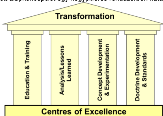
2. kép: A COE-k működési területeit ábrázoló négy elméleti pillér 9

A NATO Transzformációs Parancsnoksága (NATO ACT) által, a kiválósági központok részére meghatározott alapkonceptiót egy négypilléres rendszerben határozta meg.