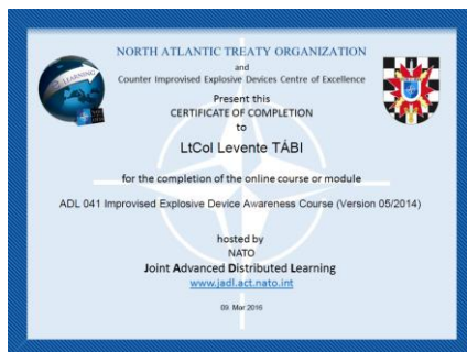
3. kép: ADL-041 teljesítéséről kiadott bizonyítvány 18

Az Advanced Distributed Learning (ADL) nem egyedi fenomén. Az ADL amerikai kezdeményezésként indult az 1990-es évek elején. Célja a kutatás, fejlesztés és a távoktatás biztosításával a civil lakosság és a kormányzati szféra alkalmazottak tudásszintjének fejlesztése. 16 Ennek továbbfejlesztésével a NATO ACT létrehozta a saját NATO távoktatási weboldalát: a „NATO Joint Advanced Distributed Learning” (JADL) weboldalt ( https://jadl.act.nato.int ). 17 Ezen a weboldalon, regisztrálás követően minden jogosult, a saját szakmai igényének megfelelően, számos digitális tanfolyamot végezhet el, melyek sikeres teljesítésével a rendszer hivatalos igazolást ad ki a hallgató részére.