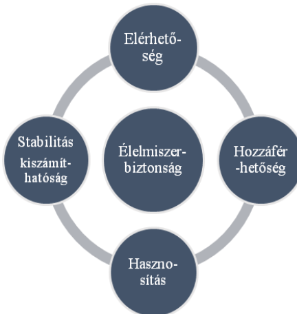
1. ábra: Az élelmiszerbiztonság négy pillére