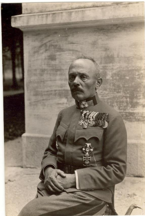
1. sz. fénykép: Svetozar Boroević von Bojna

Az Osztrák-Magyar Monarchia haderejében számos horvát származású katonatiszt és tábornok szolgált a Nagy Háborúban, közülük a legközismertebb és a legmagasabb rangot elért – az első világháború végén a birodalom kilenc tábornagyának 2 egyike – Svetozar Boroević volt.