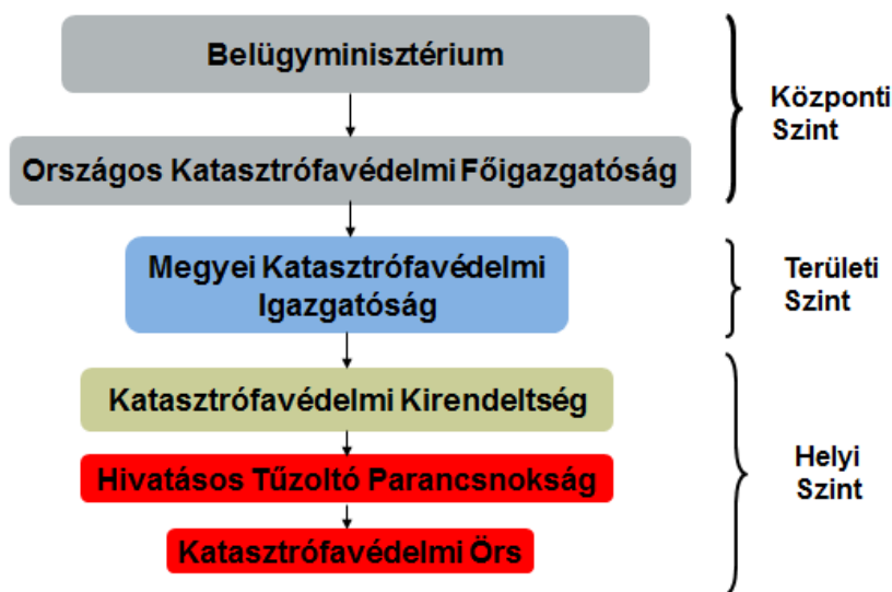
2. ábra A katasztrófavédelem szervezeti rendszere

A fogalmak aktualizálásán túlmenően a feladatok hatékony végrehajtása érdekében szervezeti változásokat is eredményezett a KAT törvény. Az egységes katasztrófavédelmi rendszer új szervezeti egységeiként kezdték meg működésüket a katasztrófavédelmi kirendeltségek, melyek helyét a katasztrófavédelem rendszerében a következő ábra mutatja.