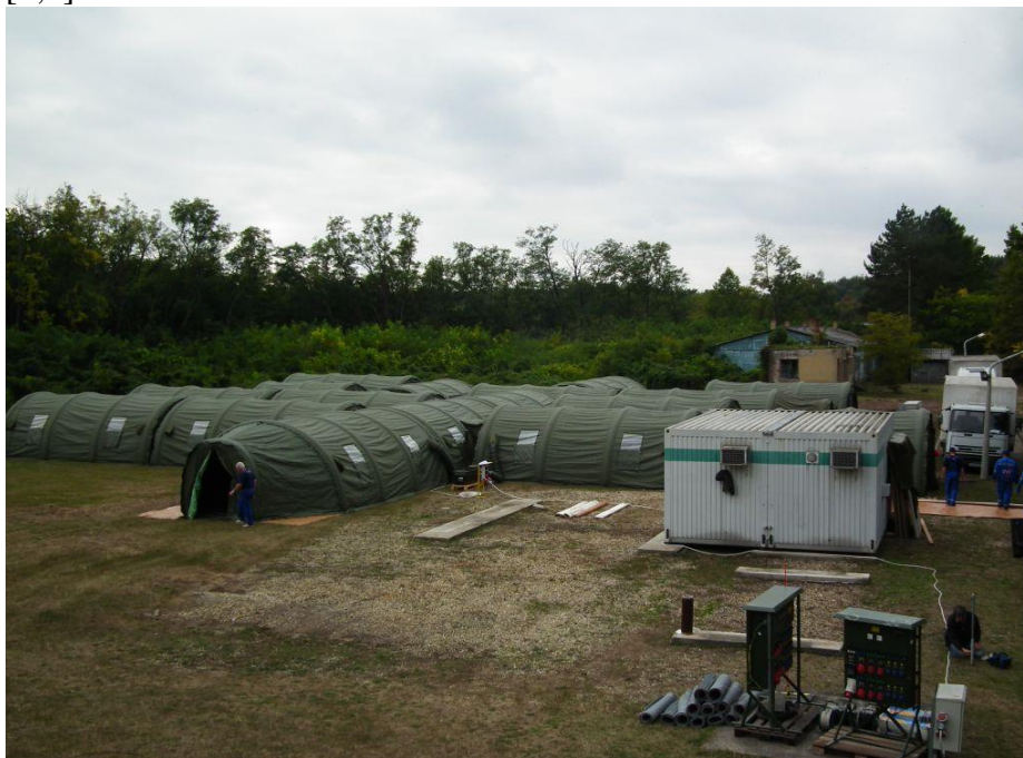
4. ábra Telepített Mobil Orvosi Segélyhely (MOSH) 2 (Készítette a szerző, forrás: Magyar Honvédség Kiképző Bázisa, 2014.10.08.)

A Mobil Orvosi Segélyhely a sérültek osztályozására, a tovább szállításra való felkészítésére, az első életmentő szakorvosi ellátásra alkalmas orvosi segélyhely. Fűthető-hűthető sátrakban települhet, saját víz- és áramellátással rendelkezik, ezért a kórhelyhez közeli önálló működésre is alkalmas, így szükség esetén szinte bárhol telepíthető, 2-3 napi működésre, mintegy 1000 sérült ellátására alkalmas. Mivel ez az Állami Egészségügyi Tartalék leggyorsabban mobilizálható eleme, katasztrófa esetén elsőként kerülhet alkalmazásra, továbbá a Mobil Szükségkórház egyes elemeinek rátelepítésével akár kórházként is tovább működtethető. Egy műtőblokkal rendelkezik, melyben 2 asztalon egyidejűleg 2 műtési team dolgozhat. [4;5]