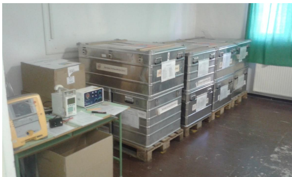
5. ábra Összekészített Gyorsreagálású Segélycsapat Felszerelés (GYSF) 3 (Készítette a szerző, forrás: Állami Egészségügyi Ellátó központ Kappel Emília utcai raktár, 2018.11.07.)

A GYSF által biztosított ellátás szakmai terjedelme a segélycsapat létszáma és szakmai összetétele okán is elsősorban az első életmentő orvosi elsősegélynyújtásra, a kisebb sérülések ellátására, továbbá háziorvosi sürgősségi ellátásra ad lehetőséget. [4;5]