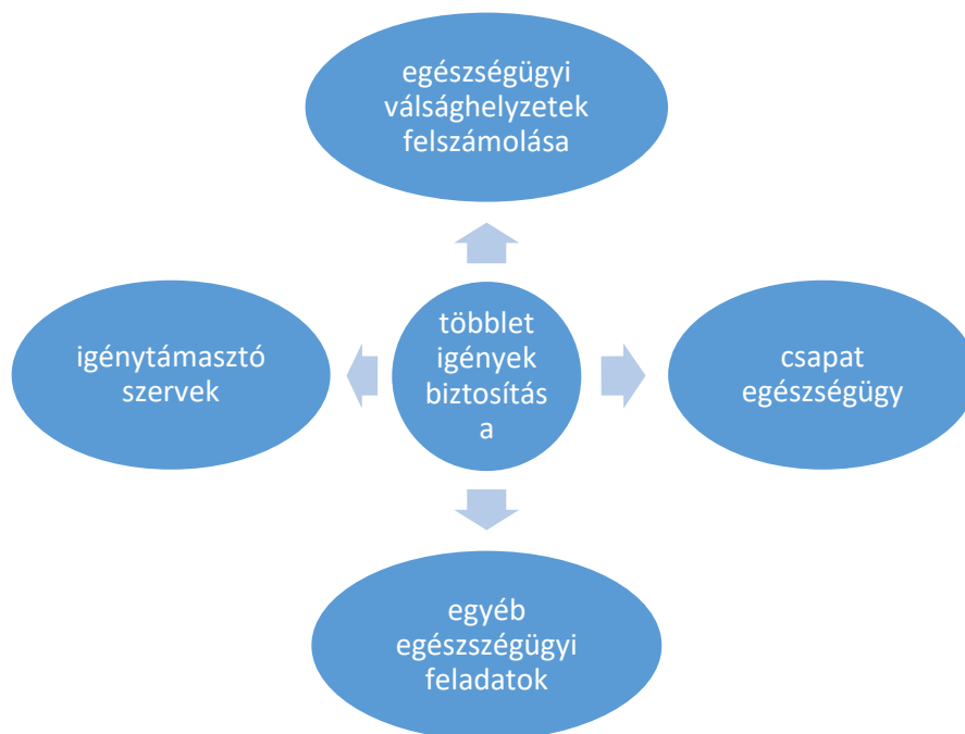
1. ábra. Az Állami Egészségügyi Tartalék rendeltetése (Készítette a szerző, forrás [3])

A tartalék rendeltetését az 1. ábra is szemlélteti: