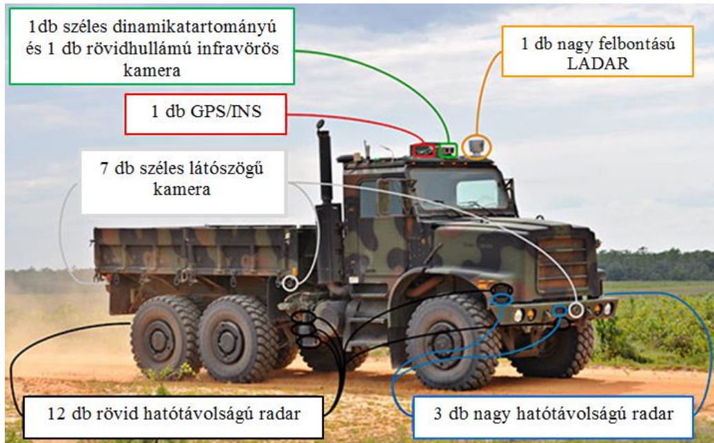
2. kép A TerraMax rendszerrel ellátott vezető nélküli szállító jármű szenzorai [11]

A navigációt és helymeghatározást a GPS és inerciális navigációs rendszer együttes alkalmazása biztosítja, így ha korlátozott a GPS jel, az INS továbbra is kiszámíthatja a pozíciót és a szöveget az elveszett GPS-jelek időtartama alatt. [11] Az alkalmazott érzékelőket az 2. kép mutatja részletesen.