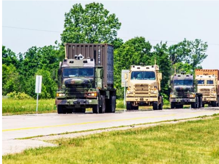
1. kép Platooning rendszerrel működő katonai járműkonvoj Michigan-ben. [6]

A platooningnak több fajtája is szóba jöhet: