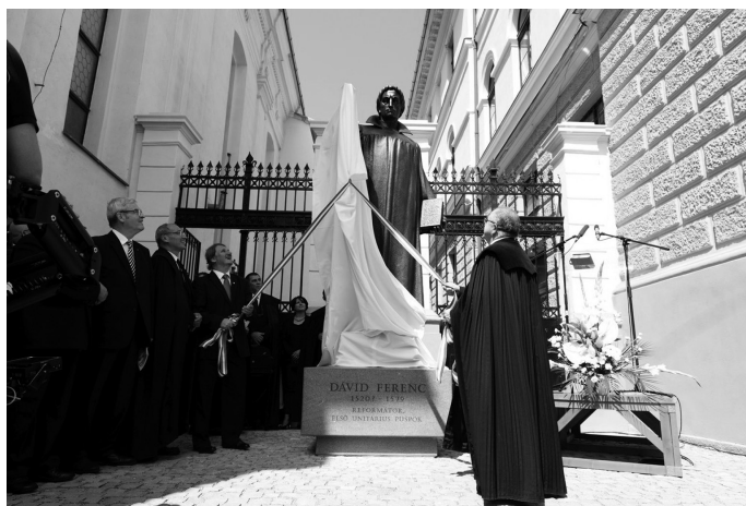
6. ábra: Dávid Ferenc szobrának avatása Kolozsváron 2019. augusztus 17-én Forrás: Szobrot kapott Kolozsváron az unitárius egyház alapítója 2019.

Másrészt az is, hogy 2019. augusztus 17-én felavatták az unitárius egyház alapítójának egész alakos szobrát Kolozsváron.