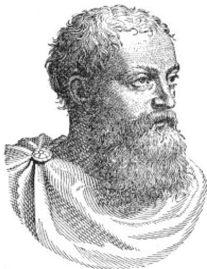
5. ábra: Blandrata György

Így Dávid Ferenc – betartva a törvényes kereteket – már 1578 márciusában Tordán zsinatot tartott 322 lelkész részvételével, amely elfogadta az úgynevezett communis profetia elvét, azaz azt, hogy a zsinatilag meg nem állapított hittételekről szabadon lehet vitatkozni. 13 A valóságban ez az elv csak reakció volt az innovációs törvényre, és további lehetőséget biztosított nemcsak a további hitviták, hanem a vallásszabadság számára is.