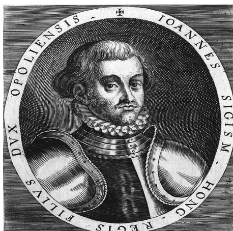
3. ábra: János Zsigmond

Itt most előzményként csak annyit érdemes megjegyezni, hogy a maga is unitáriussá vált János Zsigmond erdélyi fejedelemsége idején, az 1571. január 6. és 14. között megtartott országgyűlés a kialakult és befogadott vallások védelmében és a kriminális vallások kiűzéséről hozott határozatot. Majd a hitújítással szemben az ezt követő országgyűlések további szigorításként innovációellenes határozatokat hoztak, sőt úgynevezett „innovációs perekre” is sor került.