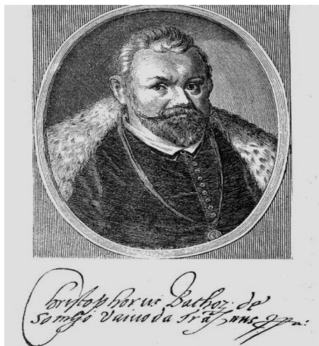
4. ábra: Báthory Kristóf arcsképe és aláírása

Mindezen összefüggések általánosan jól összegezhetők Kukorelli István alkotmányjogász azon gondolatával, hogy örök vita az állam és az egyház kapcsolata, az ideális modell, amely a történelem, a jog és a politika függvénye. 12